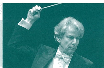
ハルトムート・ヘンヒェン [指揮] Hartmut Haenchen, Conductor

ドレスデン生まれ。C.Ph.E.バツ室内管弦楽団・音楽監督、ネザーランド・フィル及びネザーランド室内管弦楽団・首席指揮者、ネザーランド・オペラ音楽監督・首席客演指揮者を務める。ベルリン・フィル、ドレスデン州立歌劇場管、ロイヤル・コンセルトヘボウ管など世界各地のオーケストラに客演している。